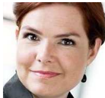
Tirsdag den 7. april 2009 blev Inger Støjberg udnævnt som beskæftigelsesminister og minister for ligestilling. Inger Støjberg er født i 1973 og har siddet i Folketinget siden 2001.