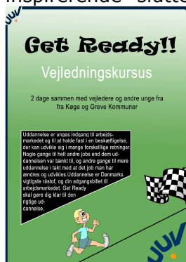
Get Ready: En UUV indsats i forbindelse med Jobcenterets deltagelse i Beskæftigelsesministeriets projekt "Unge – godt i gang". Uddannelsesafklaring over et 2-dages forløb