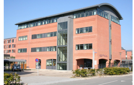
Centerholmen 18, Greve

Der er styr på de unge i Greve. På blot 2 år har der været en stigning på over 10 % af unge 20 årige, der har gennemført en ungdomsuddannelse i Greve. Med 7.761 årlige kontakter til unge mellem grundskolen og det 25. år dokumenterede UUV et fintmasket net under unge i Greve.