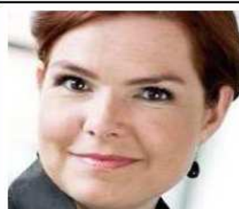
Tirsdag den 7. april 2009 blev Inger Støjberg udnævnt som beskæftigelsesminister og minister for ligestilling. Inger Støjberg er født i 1973 og har siddet i Folketinget siden 2001.